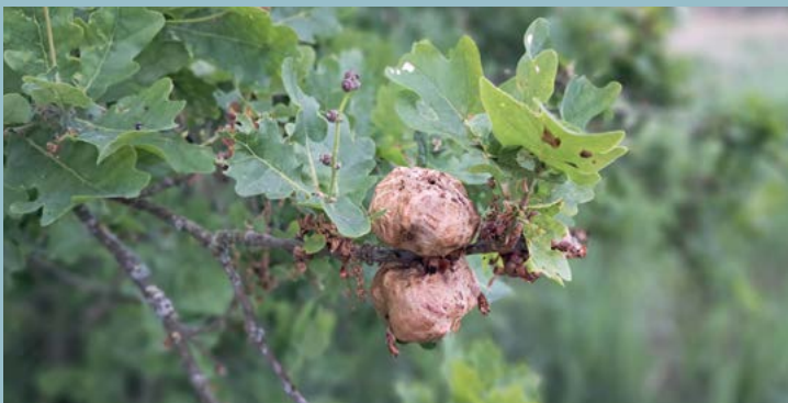
Aardappelgallen in de eiken bij Heukelom RALPH AKKERMANS

Om het Natuurnetwerk Brabant te realiseren, verwerft ARK Rewilding Nederland gronden in Het Groene Woud. Dat doen we in het kader van het natuurrealisatieproject Brabants Goud in Het Groene Woud. Per 1 mei 2025 beschikten we over ruim 494 hectare grond. De ARK-methode: we verwerven gronden, zorgen voor de natuurinrichting en het tijdelijk beheer ervan. Eén van onze meest recente Brabants Goud-aankopen ligt tussen Olland en Sint Oedenrode.