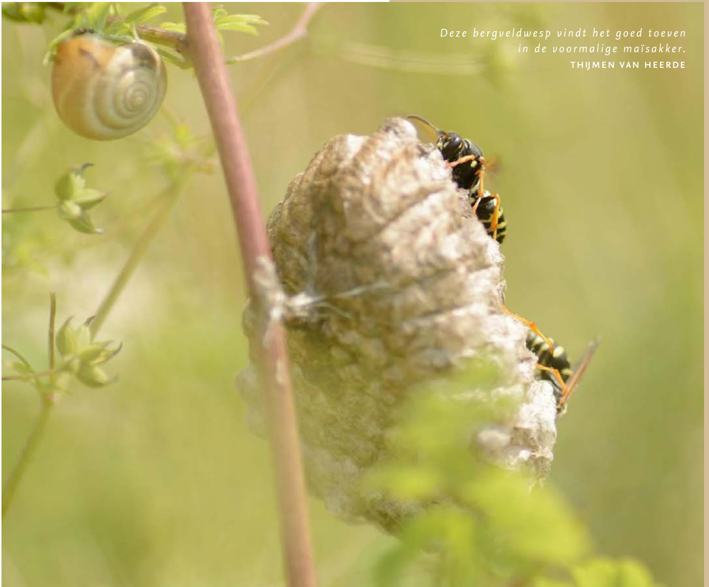
Deze bergveldwesp vindt het goed toeven in de voormalige maïsakker. THIJMEN VAN HEERDE

Bergveldwespen zijn opvallende, slanke wespen die in kleine kolonies leven en op insecten zoals rupsen jagen. Ze zijn zelden agressief en spelen een erg nuttige rol in het ecosysteem. Deze wespenssoort is één van de twee meest voorkomende veldwespen in Nederland. Thijmen: “Dat we ze nu op deze locatie in Spoordonk vinden, is precies hoe we het graag zien. Hun aanwezigheid is een mooie aanwijzing dat het oude maïspaneel zich al begint te ontwikkelen naar een robuuster, meer natuurlijk systeem. Insecten staan de laatste decennia erg onder druk. Daarom is het extra bijzonder om te merken hoe snel de natuur reageert als je haar weer de ruimte geeft.”