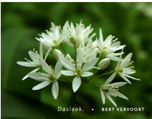
Daslook. • BERT VERVOORT

Dat de bodem in De Geelders tot bijzonder leven leidt, laat de paar vierkante meter daslook zien die hier al enkele jaren pal aan de Beeksche Waterloop groeit.