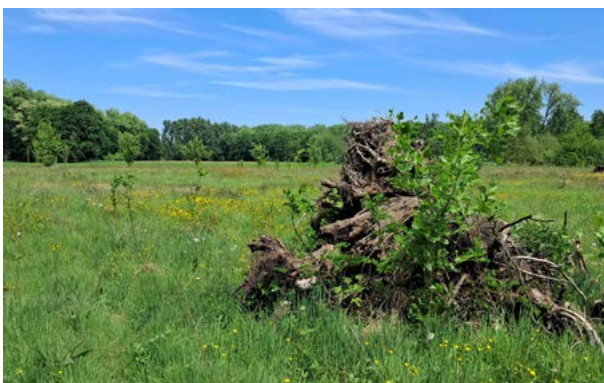
Dode boomstronken op 't Hoefje in Olland.

Dood hout speelt een sleutelrol in de natuur. Afgestorven bomen met afbladderende bast, dode takken, stammen als een gatenkaas, omgevallen reuzen met een kroon van wortels... Ze zijn een ideale schuilplek voor dieren en mooie broedplaatsen en uitkijkposten voor heel veel vogels. Ook keversoorten, torren en andere insecten leven 'van' dood hout. In totaal is