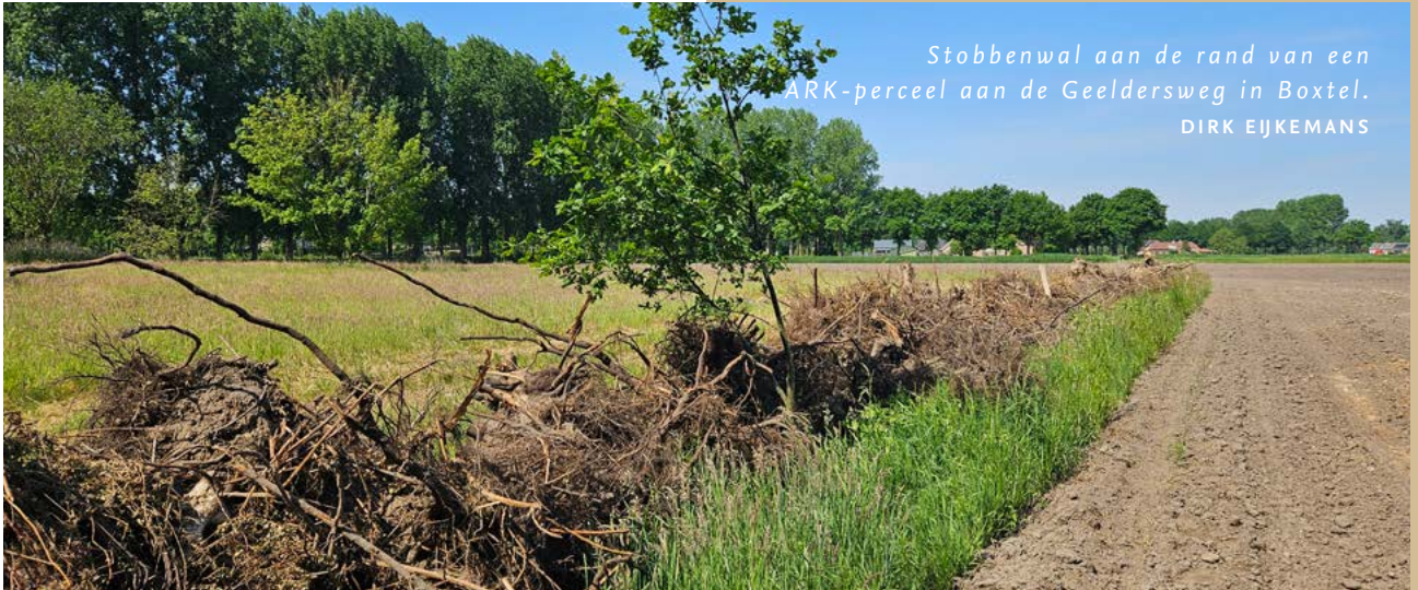
Stobbenwal aan de rand van een ARK-perceel aan de Geeldersweg in Boxtel. DIRK EIJKEMANS