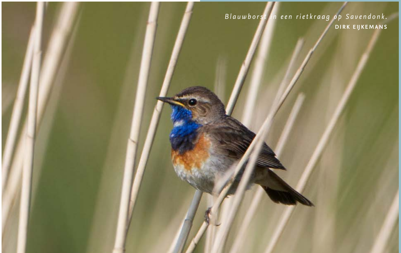
Blauwborst in een rietkraag op Savendonk. DIRK EJKEMANS