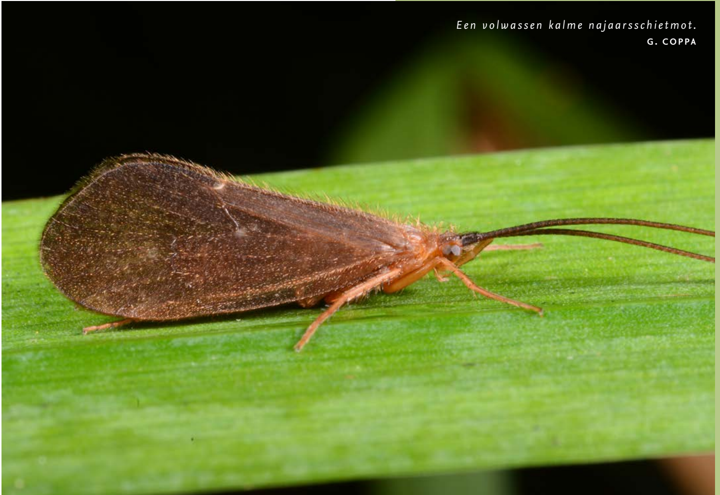
Een volwassen kalme najaarsschietmot. G. COPPA