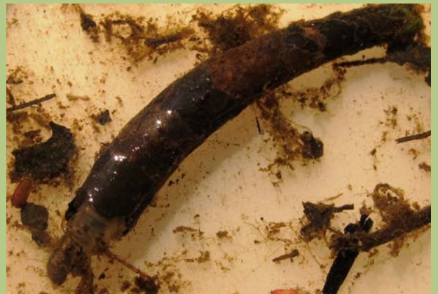
Een larve van de zeldzame kalme najaarsschietmot. • DAVID TEMPELMAN

Dat hier nu larven zijn aangetroffen, heeft alles te maken met de bomen, het langzaam stromende water van de Berkenloop en de leembodem. Alle drie zorgen ze voor grote overlevingskansen voor deze kokerjuffersoort. De larven gebruiken namelijk stukjes boomblad om hun cilindrische, sterk gekromde kokertjes te bouwen waarmee ze zich beschermen. Ze gebruiken daar ook stukjes blad van grote waterranonkel, mannagrass en/of sterrenkroos voor. Verder eten ze bladmateriaal dat van de bomen afkomstig is. Dus ook om die reden is het voor hun overlevingskansen erg belangrijk dat er bomen naast beken of sloten staan. Daarnaast biedt de vochtige leembodem van