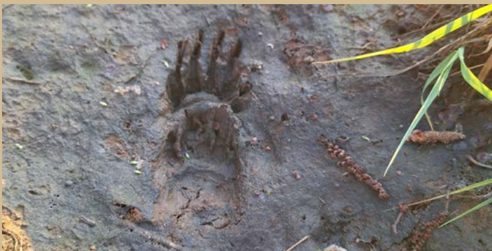
Diepe pootafdruk van een das aan de Hooge Beek TON POPELIER

Om het Natuurnetwerk Brabant te realiseren, verwerft ARK Rewilding Nederland gronden in Het Groene Woud. Dat doen we in het kader van het natuurrealisatieproject Brabants Goud in Het Groene Woud. Per 1 april 2025 beschikten we over ruim 493 hectare grond. De ARK-methode: we verwerven gronden, zorgen voor de natuurinrichting en het tijdelijk beheer ervan. Eén van onze meest recente Brabants Goud-aankopen ligt in de buurt van Cromvoirt in Vught.