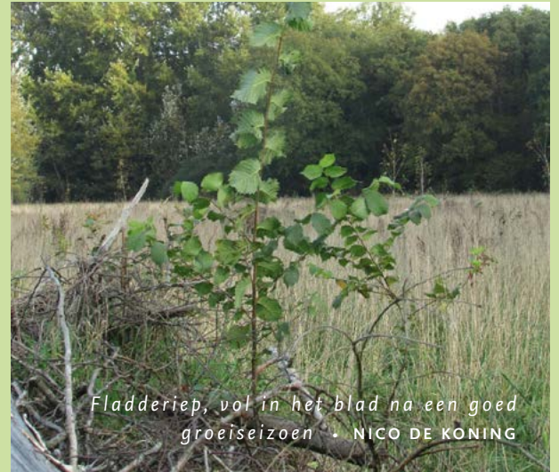
Fladderiep, vol in het blad na een goed groeiseizoen • NICO DE KONING

Zonder aanplant kan het tot tientallen jaren langer duren voordat hier zoveel struiken en bomen staan. Die zijn dan ook nog eens van een beperkt aantal soorten. De natuur een handje helpen, is dus het credo. Al benadrukt Nico dat de natuur vooral zelf bepaalt welke tijd ze nodig heeft. “We willen echter wel voorkomen dat bepaalde snelgroeiende kruiden overal dominant worden. In De Geelders zou je dan vooral beplanting gaan zien die van voedselrijke gronden houdt en van veel zonlicht, simpelweg omdat je deze factoren veel vindt op de voormalige landbouwgronden. Die consequentie is niet optimaal voor de biodiversiteit en soorten die De Geelders en Het Groene Woud juist zo bijzonder maken.”