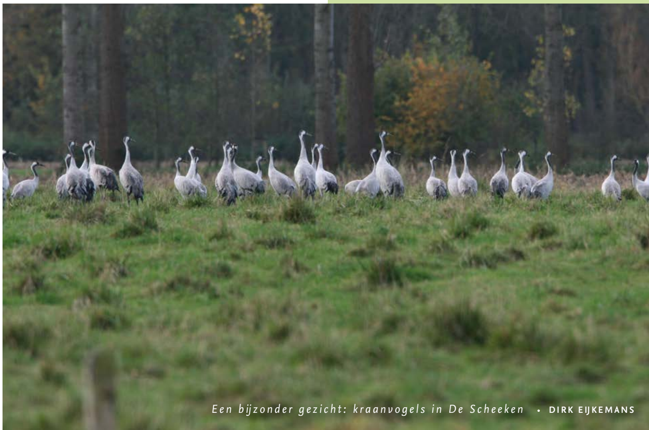
Een bijzonder gezicht: kraanvogels in De Scheeken • DIRK EJKEMANS