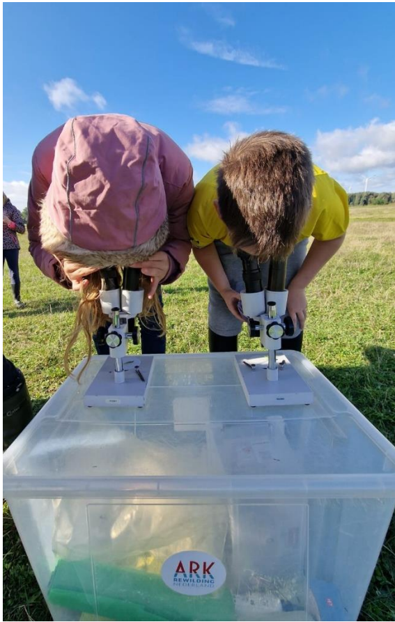
Figuur 7: Gluren door de stereomicroscopen.