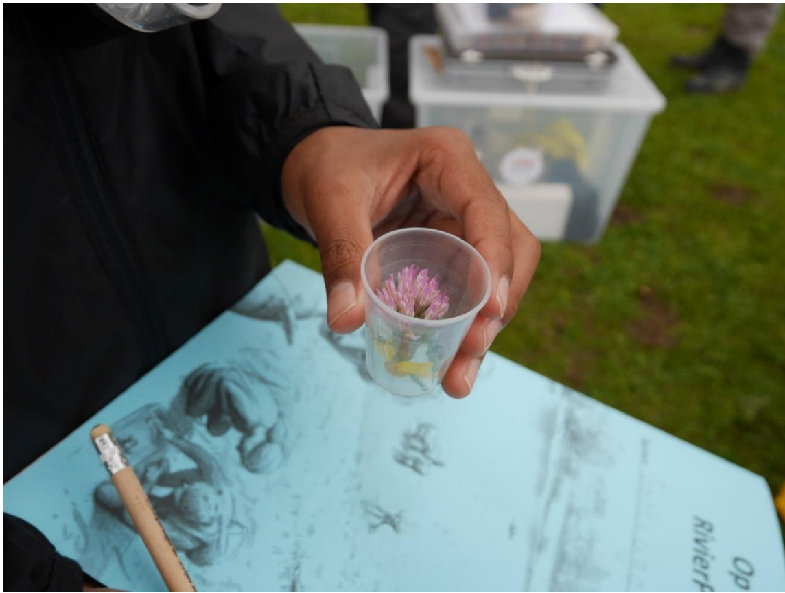
Figuur 5: Neuzen naar geuren