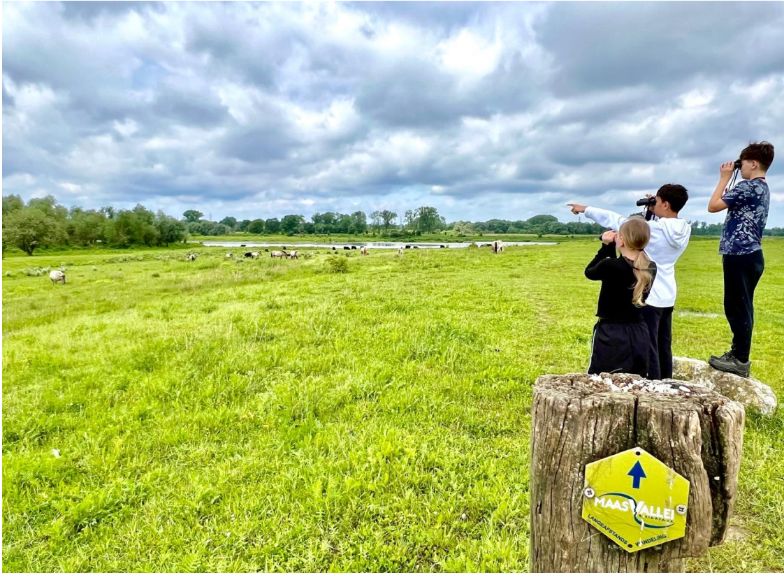
Figuur 9: Grote grazers spotten met de verrekijkers