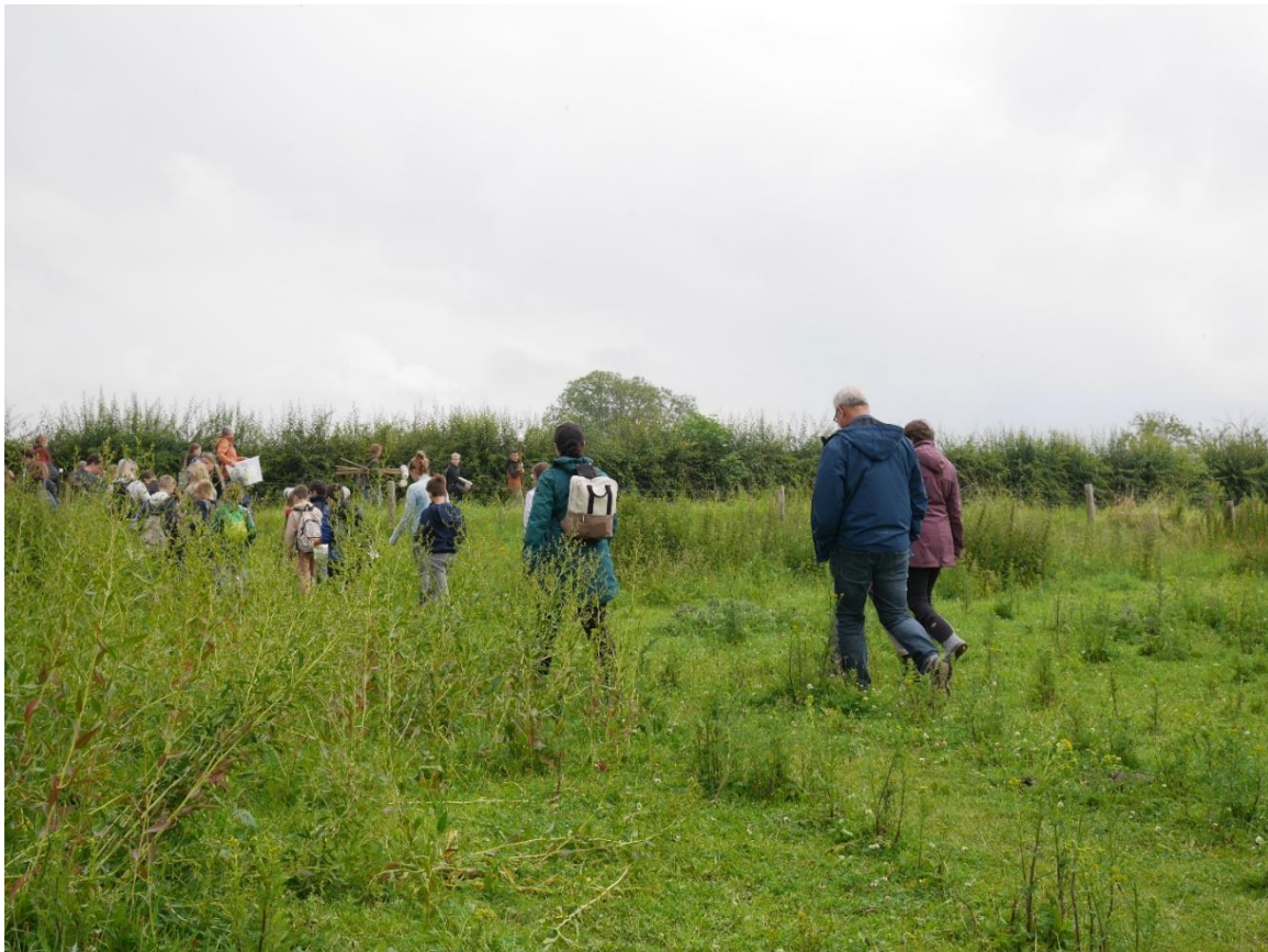
Figuur 6: Na afloop samen door het veld met alle spullen terug naar de parkeerplaats.