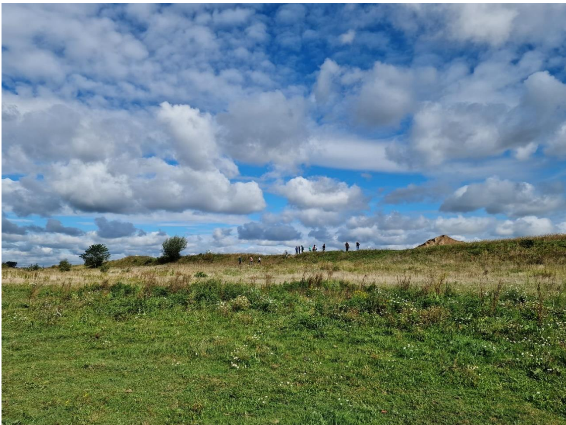
Figuur 10: (Re)wilde horizon in Meers