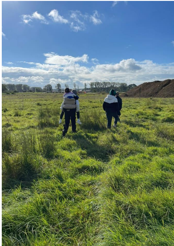
Figuur 8: Het was soms erg drassig. Handig als je dan kan meeliften op de schouders van je klasgenoten!