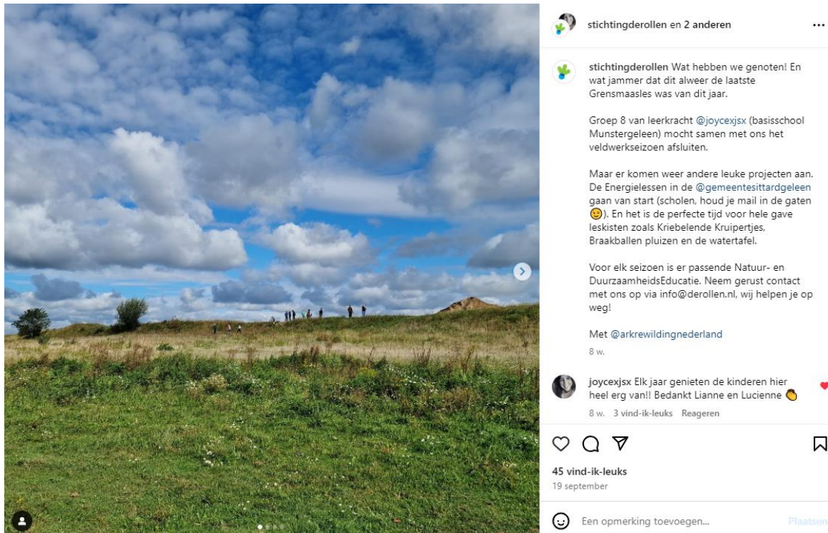
Figuur 11: Bericht over het einde van de Grensmaaslessen met enkele foto's. Deze foto's krijgen we van leerkrachten en mogen ook op social media verspreid worden.

Dit jaar hebben we actiever dan voorgaande jaren aandacht besteed aan de Grensmaaslessen via social media. Nieuw is ons Instagram account, maar ook via Facebook hebben wij een bericht gedeeld. Daar hebben we, waar relevant, ARK Rewilding in meegenomen.