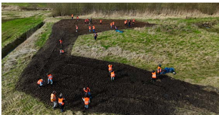
Een spectaculair dronebeeld van de boomplantdag in Lennisheuvel vanuit de lucht.

Op maandag 19 februari jl. vond er ook een boomplantdag plaats in Lennisheuvel, op een ARK-perceel dat aan de Beerze grenst. 29 enthousiaste kinderen van groep 7 en 8 van basisschool De Klim uit Lennisheuvel plantten hier, samen met twee juffen en enkele ouders, maar liefst 750 bomen.